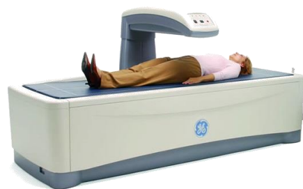
大久保病院の骨密度測定装置

椎体(背骨)と大腿骨(太もも部)の両方を検査することで骨粗しょう症の早期発見や治療効果の経過観察ができます。