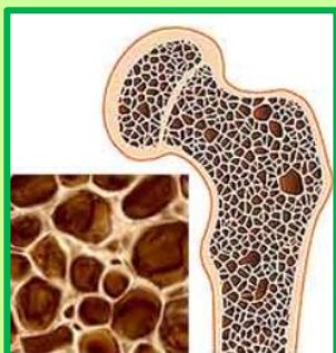
骨粗しょう症 (スカスカの骨)